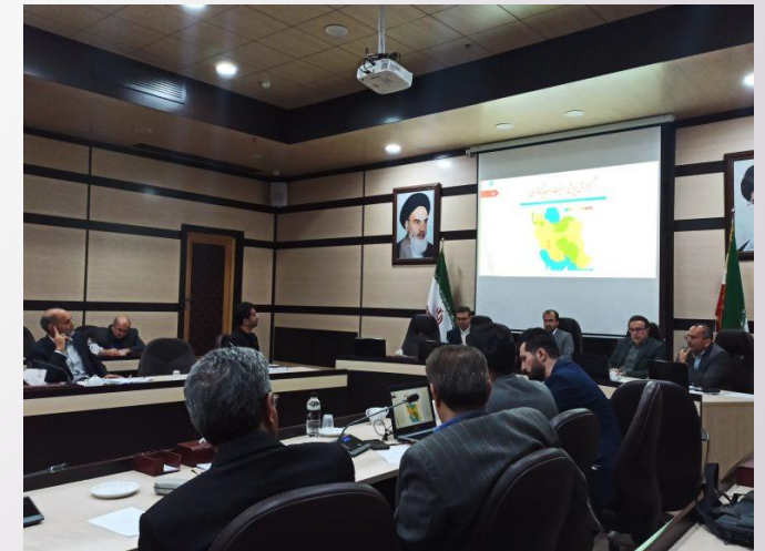
کمیسیون بهبود محیط کسب و کار اتاق بازرگانی، صنایع، معادن و کشاورزی خراسان رضوی