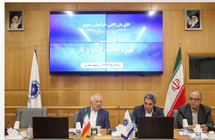
کمیسیون بهبود محیط کسب و کار اتاق بازرگانی، صنایع، معادن و کشاورزی خراسان رضوی