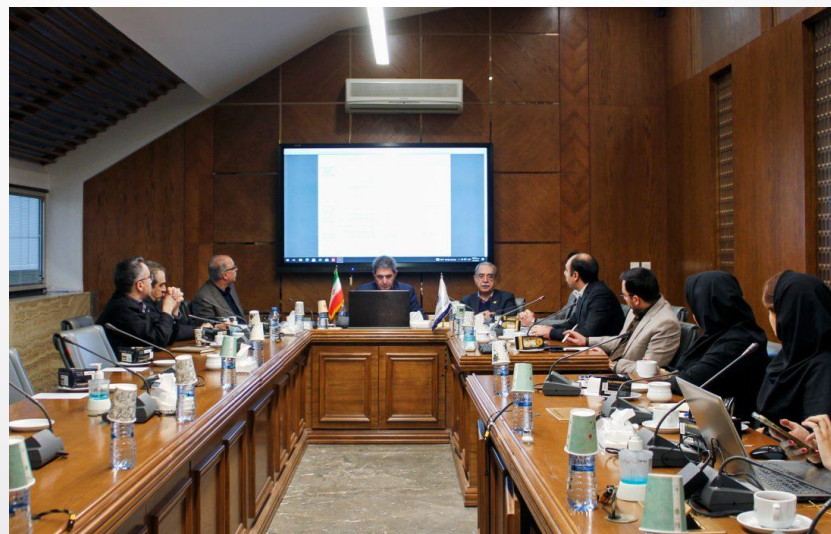
کمیسیون بهبود محیط کسب و کار اتاق بازرگانی، صنایع، معادن و کشاورزی خراسان رضوی