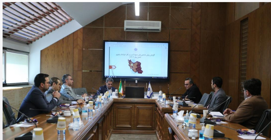
کمیسیون بهبود محیط کسب و کار اتاق بازرگانی، صنایع، معادن و کشاورزی خراسان رضوی