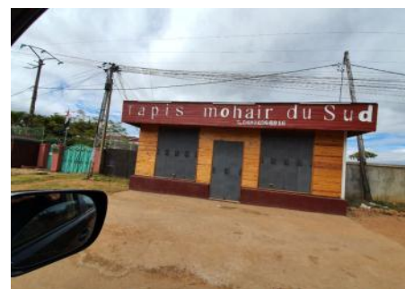
فروشگاه فرش موحر در نزدیکی فرودگاه پایتخت

تهیه کننده: حسن علی بخشی - کاردار جمهوری اسلامی ایران (۱۴۰۱/۷/۲۲)